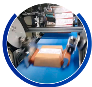
Rodillos laterales para pegado lateral y "cierre" de producto