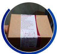
Salida producto final