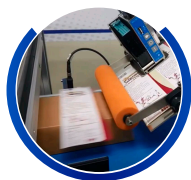
Rodillo frontal aplicador de etiqueta

Su uso es principalmente para envases de alimentos, por ejemplo, clamshell y bandejas plásticas, entre otros.